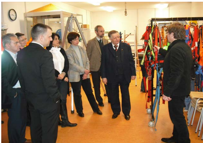
Besuch des Arbeitssicherheitstrainingszentrums der BG Bau in Haan