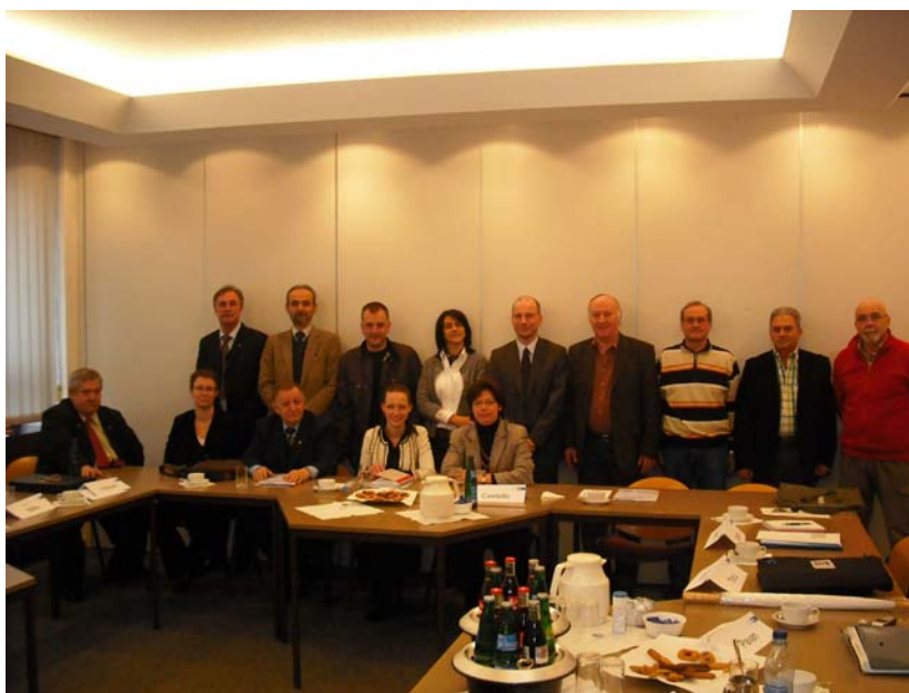
2. Projekttreffen in Krefeld

Als nächstes Projektziel steht die Beantragung eines Leonardo Transferprojektes über 3 Jahre zur Entwicklung eines Curriculum für das Praxistraining und eines unterstützenden Lernprogramms für das Handy bzw. den PC als web-based Trainingseinheit, welches jederzeit an jedem Ort aus dem Internet aufgerufen werden kann und aufgrund von Filmen und Piktogrammen von allen eindeutig verstehbar ist. Der Antrag wird von den Projektpartnern gemeinsam formuliert und im Februar 2010 eingereicht.