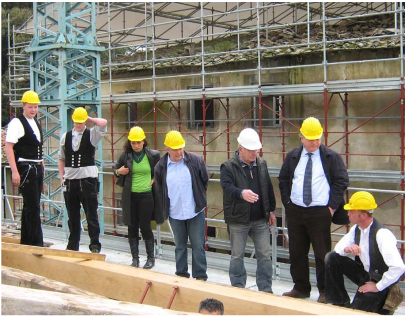
Bild oben: Abstimmung mit Ingenieur und Architekt über den Aufbau des neuen Daches der historischen Villa Canonica.