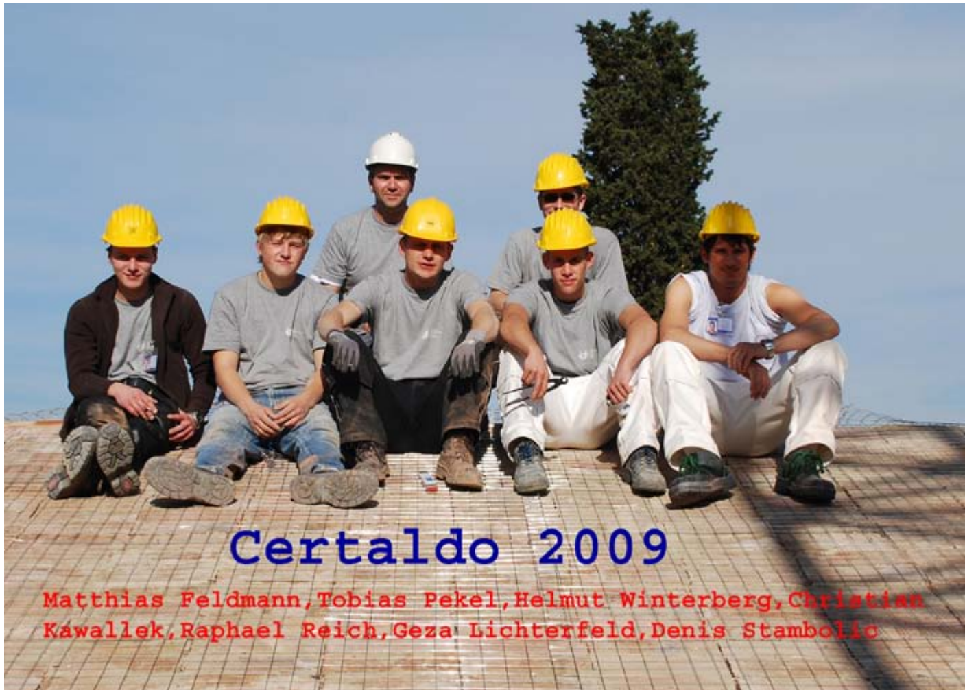
Das BZB-Team aus Wesel (v.l.n.r)

Abschlussarbeiten an der "Villa Canonica" in Certaldo