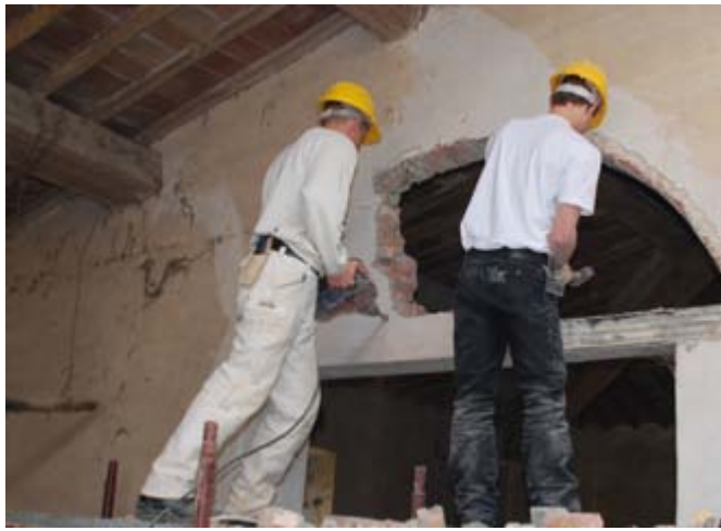
Wiederherstellung der alten Rundbögen über den Türöffnungen