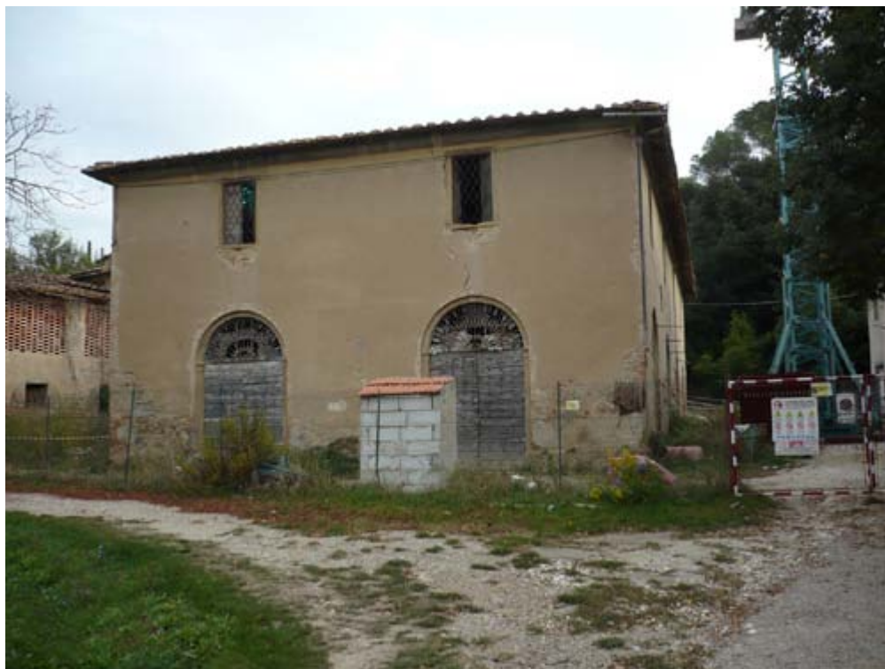
Weinkelterei, Nebengebäude der Villa Canonica