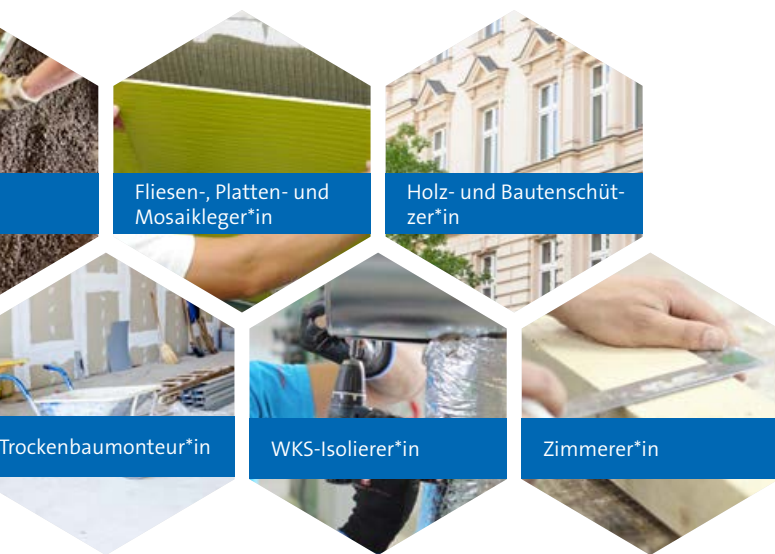
Fliesen-, Platten- und Mosaikleger*in